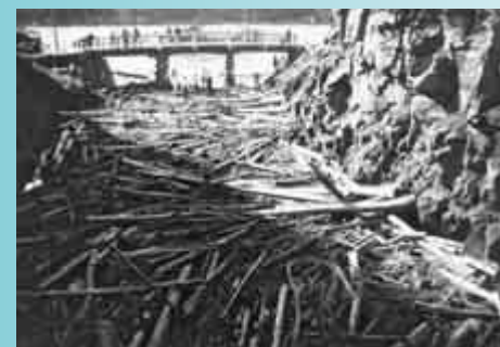
流木でふさがれた八尾川放水路