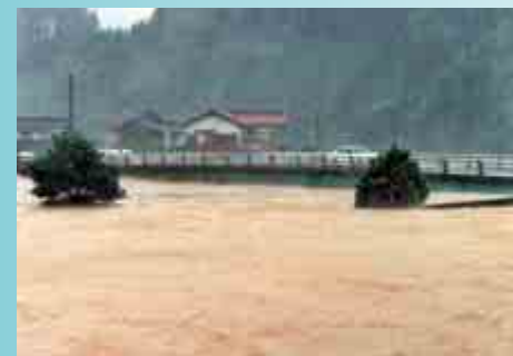
役場前の八尾川が溢れ、川と駐車場の境界が確認できない