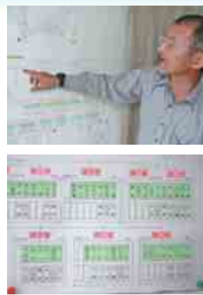
きちんと整備された組織図

訓練は、避難とはどのようなものかをみんなで体験してみようということで実施しました。少しずつレベルアップしていくと、今年は、担架を使った避難訓練を計画しています。