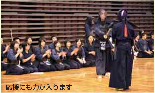
応援にも力が入ります

5月29日から3日間にわたり、島根県高等学校総合体育大会の剣道競技が、隠岐の島町総合体育館で開催されました。この大会には、県内の高校26校、総勢300人が参加し、インターハイ出場をかけた、日頃の稽古で磨いた技を競い合いました。