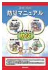
隠岐の島町防災マニュアル

昨年11月に、町内全世帯にお配りした「隠岐の島町防災マニュアル」。みなさんは、ご覧になりましたか。この冊子は、本町で想定される災害に対する日頃からの備えや、実際に災害が起こったときの対処方法等について理解するための手引書です。 各地域の避難場所や災害時の緊急連絡先なども掲載されていますので、ぜひもう一度手に取ってみてください。