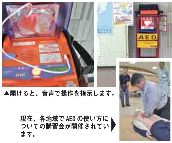
▲開けると、音声で操作を指示します。