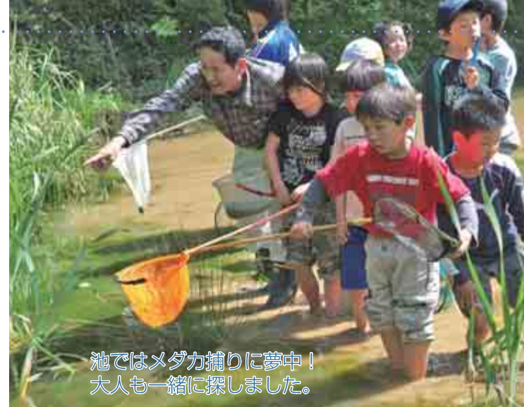
池ではメダカ捕りに夢中! 大人も一緒に探しました。

4. お問い合わせ 〒690-8523 松江市母衣町68番地 松江地方裁判所 事務局 総務課人事第一係 電話0852-23-11701 ●農林水産「もの知り出前講座」 座・「みらい講座」 のお知らせ 農林水産「もの知り出前講座」とは 島根県の豊かな自然やそれらに支えられている農林水産業の魅力などについて、みなさんの要望に応じ、県職員が出向いて説明します。 ●小中学生向け 食育―農からのアプローチ 等6メニュー ●一般向け 農林業の魅力発見等4メニュー 対象 団体・グループです。ただし、島根県