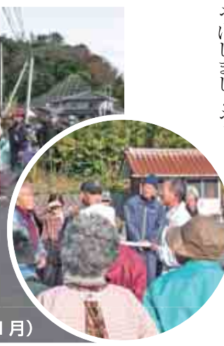
大久地区の自主防災訓練（昨年11月）

いざというときに、自主防災組織が十分に活動するためには、一人ひとりがどれだけ正しい防災知識をもっているかにかかっています。災害時に火を出さない方法や消火の仕方、応急手当の心得などを学ぶとともに、地域の中で危険だと思われる場所を調査して、防災地図を作っておく役に立ちます。