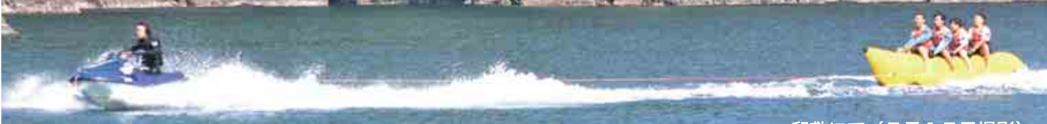
卯敷にて(5月15日撮影)

町内各所で5月13日から関西方面からの修学旅行受け入れ事業が始まりました。マリンスポーツ体験や民泊を通じた田舎暮らし体験、自然サバイバルなど隠岐の自然や暮らしを満喫するこの企画。参加人数延べ1,100人余りを迎え、6月13日まで行われました。